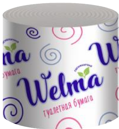
Диаметр 85 мм